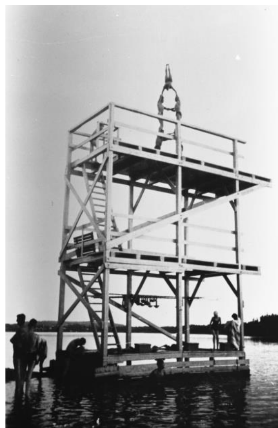
Mycket folk vid hopptornets invigning 1938. Till höger ses Vaggerydsgymnasterna från förra bilden högst upp på hopptornet vid Hjortsjön. Foton från 1938 efter Göte Sandqvist.