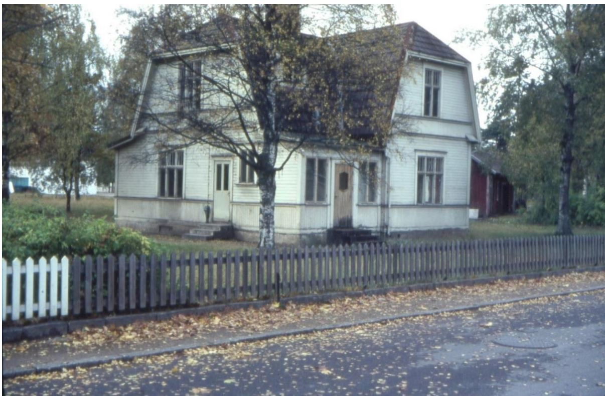
Sveavägen och fastigheten Ärlan 3, byggd av Karl Ling 1914. Huset kallades ibland "Sandqvistahuset". Fotot från omkring 1960 är taget av Folke Gustavsson. Bild lånad av Ingemar Gustavsson.